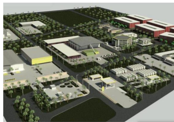
Zone de transformation Agricole (Hub de transformation de Sinématiali) à financement acquis