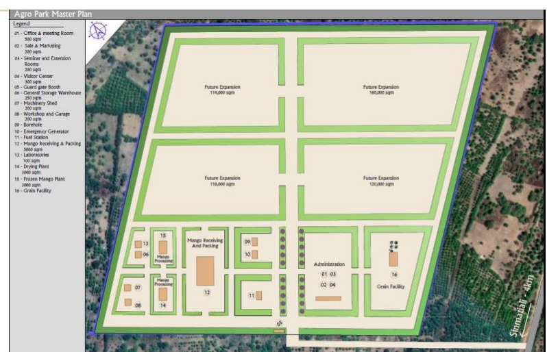
Position de l'unité complète de transformation et de conditionnement de la mangue